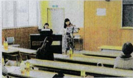
松本短大の学生による唱歌の演奏もあった設立総会

県内外の研究者や合唱団などが任意団体「日本唱歌童謡教育学会」をつくり、松本市の松本短大で18日、設立総会を開いた。子どもたちが多様な音楽ジャンルに囲まれ、音の雰囲気である童謡唱歌を歌う機会が減っている」と説明し、幼稚園や学校関係者らに参加を呼び掛ける。来年度、学生らを対象にした指導者検定や、教育や介護関係者向けに知識などを問う童謡検定の取り組みを始める予定。