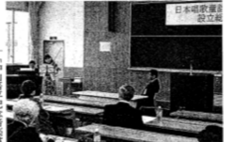
童謡のバイオリン演奏も行われた日本唱歌童謡教育学会の設立総会（松本短大で）

子どもたちが唱歌や童謡に親しむ環境をつくらせ、日本唱歌童謡教育学会が発足し、18日に事務局がある松本短大（松本市）で設立総会が開かれた。童謡検定や歌唱指導者向けの講習会を通じ、子どもたちに歌い継いでもらえる教育現場での取り組みを進める。