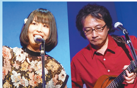
かなりやとうばん