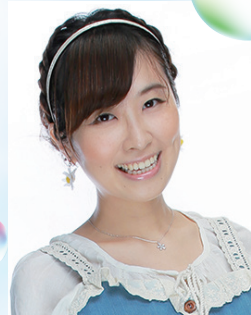
GUEST なげの あやか 童謡歌手