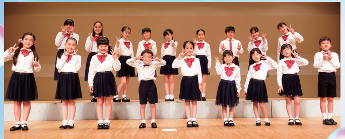
すがも児童合唱団